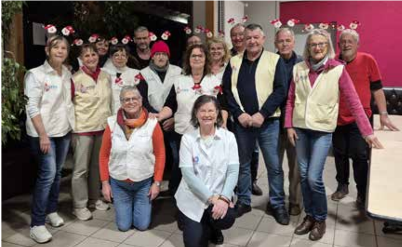
Toute l'équipe de bénévoles vous présente ses meilleurs vœux

Continuons la mobilisation. Donnons notre sang, donnons notre plasma.