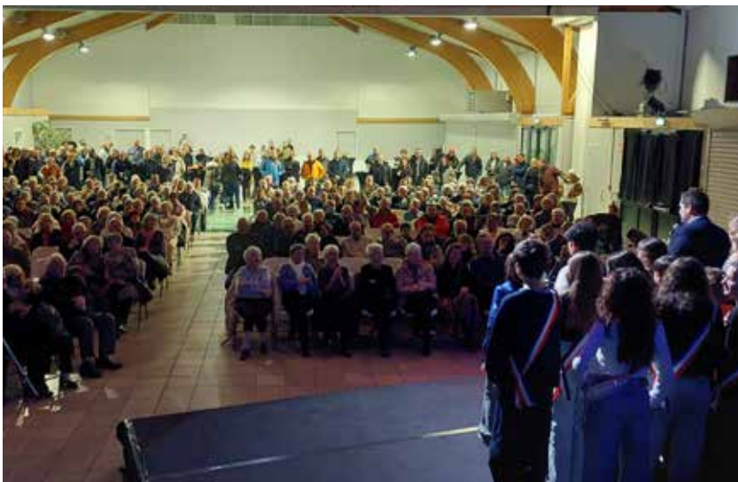
Photo Cérémonie des vœux 2026